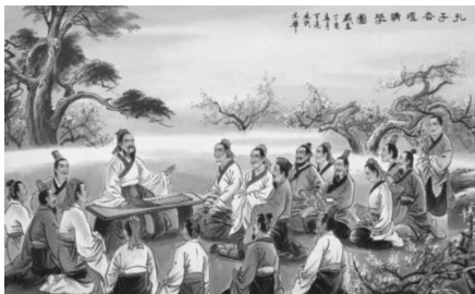
图 1-5 孔子讲学

孔子的教育实践活动主要集中在三个时期。一是在孔子“三十而立”前后,大约在他 30 岁至 35 岁期间。二是在孔子于鲁昭公二十七年自齐返鲁之后到仕鲁之前,也就是他 37 岁至 50 岁期间。这一时期是孔子教育思想、教育事业的大发展时期,引起全社会的广泛注意。弟子除了山东境内的齐、鲁外,还有从楚、晋、秦、陈、吴各地慕名而来的学生,几乎遍及主要的诸侯国。三是孔子晚年,结束长达 14 年的流浪生活,自卫返鲁,从他 68 岁到 73 岁去世,孔子进行了他最后五年的教育活动,把晚年的全部余热献给了教育事业。这期间,他还对以往教学中使用的《诗》《书》《礼》《乐》《易》等文化典籍进行整理、删定,使之成为定型的教材。也是在这一时期,孔子的教学经验进一步系统化,最终形成了完整的教育理论体系。