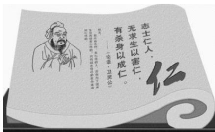
图 1-2 仁

在孔子的伦理思想中,“仁”占有极其重要的地位。孔子说:“志士仁人,无求生以害仁,有杀身以成仁。”(见图 1-2)意思是:“志士仁人,没有贪生怕死而损害仁的,只有牺牲自己的性命来成全仁的”。又说:“君子无终食之间违仁,造次必于是,颠沛必于是。”即“君子连吃一顿饭的时间也不会背离仁德,就是在最紧迫的时刻也必须按照仁德办事,就是在颠沛流离的时候,也一定会按仁德去办事”。孔子强调:“民之于仁也,甚于水火。水火,吾见蹈而死者矣,未见蹈仁而死者也。”即“人民对于仁德,比对水火的需要还急切。我见过投入水火而死的,没见践履仁德而死的”。他甚至还说:“当仁,不让于师。”由此可见,孔子对“仁”的高度重视。