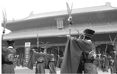
图 1-10 祭孔大典

截至 2019 年,中国(曲阜)国际孔子文化节已举办 34 届,联合国教科文组织“孔子教育奖”“孔子文化奖”已颁奖八届;世界儒学大会、尼山世界文明论坛、中韩儒学交流大会、祭孔大典(见图 1-10)等节庆活动,在国内外产生了广泛而深远的影响。经多年发展,现已有 100 多个国家和地区建立了多所孔子学院和多个中小学孔子课堂。