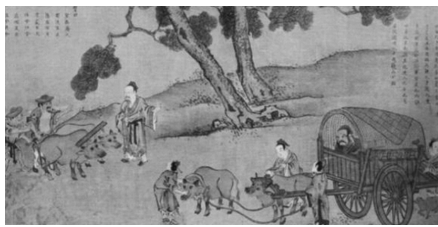
图 1-8 孔子周游列国

孔子周游列国(见图 1-8)的目的是“求仕”和“行道”，他茫然无所适从地奔走了十四年之久，到处碰壁，主要目的始终没有达到。所以司马迁说：“孔子明王道，干七十馀君，莫能用。”