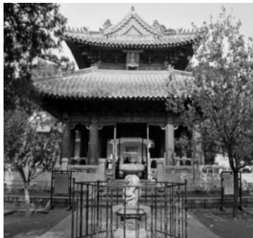
图 1-4 杏坛

孔子是中国历史上第一个伟大的教育家,在一定意义上说也是全人类历史上一个伟大的教育家。他首创平民教育,广收门徒,号称弟子三千,贤者七十二人,为继承、发展和传播古代文化做出了突出的贡献。他的教育主张、教育目的、教育方法和治学方法,直到今天仍然值得我们学习和借鉴。在山东省曲阜市孔庙的大成殿前建有杏坛(见图 1-4),相传是孔子讲学之处(见图 1-5)。后“杏坛”成为教育圣地的代名词。