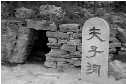
图 1-6 夫子洞

孔子的祖上是宋国的贵族，远祖是商朝开国君主商汤。周初三监之乱后，为了安抚商朝的贵族及后裔，周公以周成王之命封商纣王的庶兄微子启于商丘建立宋国，奉殷商祀。微子启死后，其弟微仲即位，微仲即为孔子的先祖。按周礼制，大夫不得祖诸侯，“五世亲尽，别为公族”，孔子六世祖孔父嘉继任宋国大司马，故其后代以孔为氏。后宋太宰华父督作乱，弑宋殇公，杀孔父嘉。宋国和鲁国毗邻，孔子五世祖木金父从宋国避祸奔鲁，孔氏为鲁国人自此始。孔子的父亲叔梁纥是鲁国出名的勇士，叔梁纥先娶施氏，生九女而无一子，其妾生一子取名孟皮，但有足疾。在当时的情况下，女子和残疾的儿子都不宜继嗣。叔梁纥晚年与年轻女子颜征在生下孔子。据说孔子生时头顶内凹（圩顶），有似阿丘，故名孔丘。生前父母曾祷于尼山，故字仲尼。后人出于对孔子的推崇，将孔子出生的山洞称为“坤灵洞”，民间又称“夫子洞”（见图 1-6）。