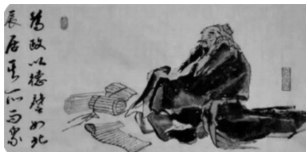
图 1-3 为政以德

为了实行德政,孔子进而提出“举贤才”的政治主张,并且把民意也列入考虑之列。所谓“举直错诸枉,则民服;举枉错诸直,则民不服”,即“选拔正直的人,罢免那些不正直的人,人民就信服你。选用不正直的人,罢免那些正直的人,人民就不会信服你”。