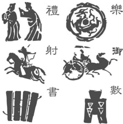
图 1-11 六艺

礼即礼节,不学“礼”无以立,所谓“仓廩实则知礼节,衣食足则知荣辱”。古代的五礼包括吉礼、凶礼、军礼、宾礼、嘉礼。民间婚嫁、丧娶、入学、拜师、祭祀自古都有礼乐之官(司礼),孔子祖上屡为司礼之官,孔子少即习礼,“为儿嬉戏,常陈俎豆,设礼容”。在国家宗庙祭祀方面,古代官方常设太常寺、祠祭署等礼仪衙曹,设立读祝官、赞礼郎、祀丞等礼仪官。