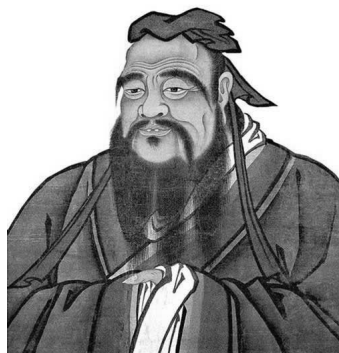
图 1-1 孔子画像

孔子(见图 1-1),我国古代著名的思想家、教育家、儒家学派创始人。孔子在古代被尊奉为“天纵之圣”“天之木铎”,是当时社会上著名的博学者,被后世统治者尊为“孔圣人”“至圣”“至圣先师”“大成至圣文宣王先师”“万世师表”等,其开创的儒家思想对中国乃至世界都有深远的影响。1988年,75位诺贝尔奖获得者在巴黎发表联合宣言,呼吁全世界“21世纪人类要生存,就必须汲取两千年前孔子的智慧”。孔子已被列为“世界十大文化名人”之首。