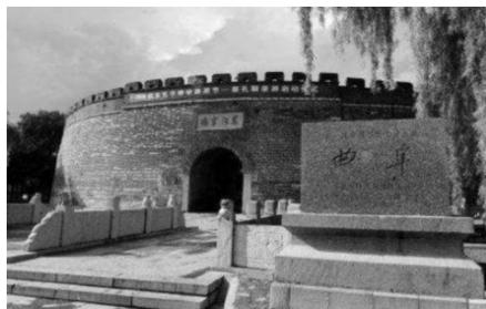
图 1-9 曲阜

因为孔子思想文化对人类的巨大贡献,世人把曲阜(见图 1-9)称为东方耶路撒冷。曲阜位于山东省西南部,历史悠久,文物众多,是世界著名旅游城市、首批中国历史文化名城。早在五六千年前,华夏、东夷祖先就在这里繁衍生息,创造了人类早期文明。据说旧石器时代中晚期,中华民族的第一个人文始祖太昊就生活在这个地区,中华文明起点即从这里开始。神